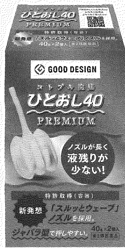
プレミアム浣腸「コトブキ浣腸」

「コトブキ浣腸」は、業界初のユニバーサルデザイン賞を受賞し、過去に医療用を含めて数回受賞しています。